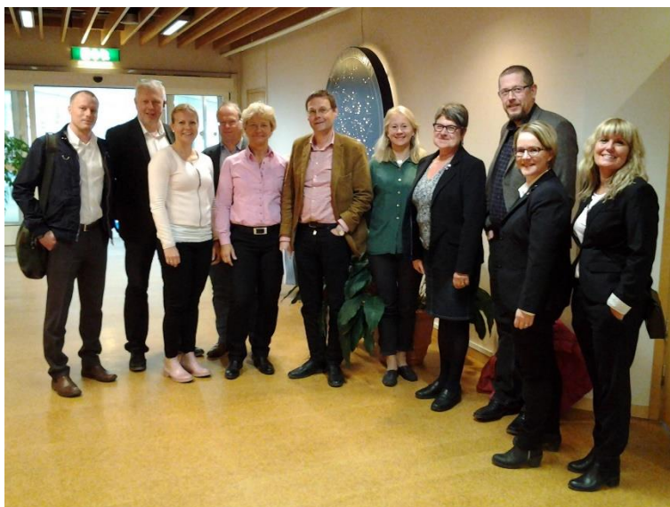
Ett återigen på Scandic i Skellefteå väl samlat Ägarråd den 24 april.

Under respektive processområde återges inom markerad ruta den huvudinriktning som slagits fast i verksamhetsdirektivet för 2015/2016 samt den inriktning och målsättningar som i sin tur ställts upp i verksamhetsplanen för 2015/2016. Redovisningen utgår ifrån de uppställda målen/huvudpunkterna under respektive rubrik i verksamhetsplanen och det är utifrån det genomförandet i form av aktiviteter och en redovisning av uppnådda mål relateras .