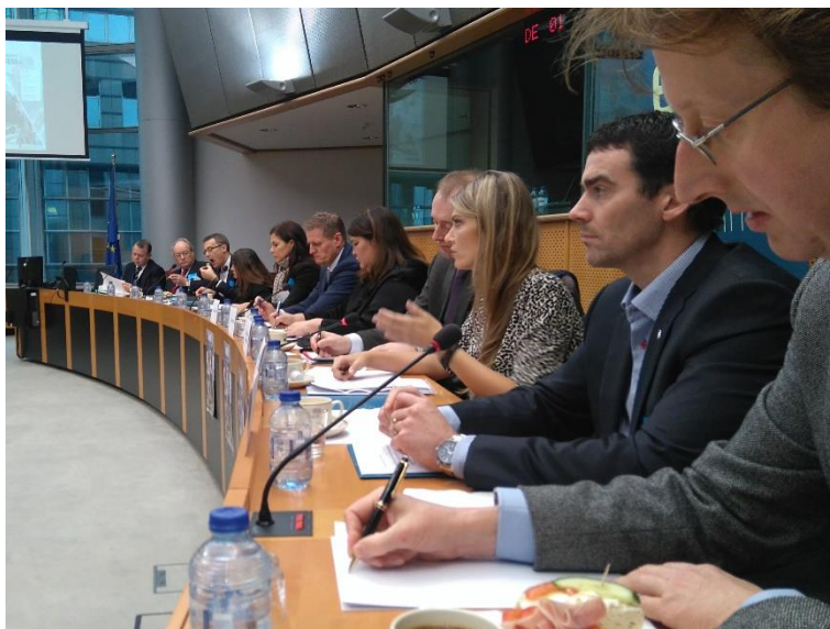
Frukostmöte i Europaparlamentet, EP, om utveckling av Arktis, 18/11.