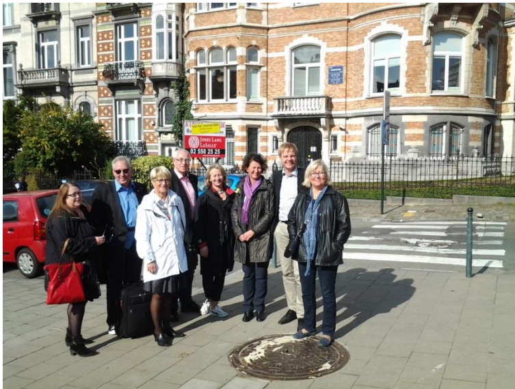
Delar av styrelsen utanför North Swedens kontor i Bryssel under Open Days.

Under respektive processområde återges inom markerad ruta den huvudinriktning som slagits fast i verksamhetsdirektivet för 2012 samt de målsättningar som i sin tur satts upp för de uppspaltade uppdragsprojekten i verksamhetsplanen för 2012. Redovisningen utgår ifrån de uppställda målen/huvudpunkterna under respektive rubrik i verksamhetsplanen och det är utifrån det genomförandet i form av aktiviteter och en redovisning av uppnådda mål relateras i denna verksamhetsberättelse.