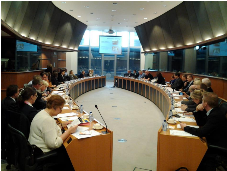
Seminarium i Europaparlamentet om råvaror och transporter i norra Europa i regi av North Sweden.

Samverkan mellan nätverket för Northern Sparsely Populated Areas och Botniska Korridorerna-gruppen, med Europaparlamentariker, ledande företrädare i EU-kommissionen med ansvar för råvarufrågor och infrastruktur/TEN-T samt företrädare för industri m fl runt bordet.