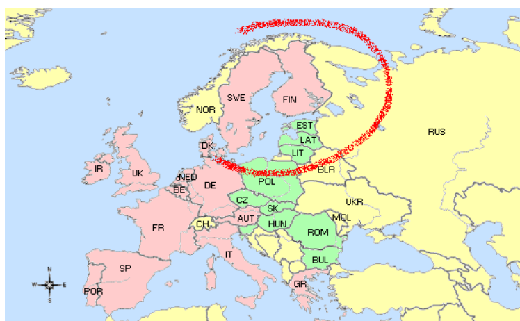
Kartan visar det område som omfattas av den Nordliga Dimensionen

Nordliga Dimensionen är det finska politiska initiativ som syftar till att sätta norra Europa på kartan. Initiativet har ingen egen budget men det har funnit en politisk plattform inom följande områden: miljö, kärnsäkerhet, åtgärder mot organiserad brottslighet, Kaliningrad, energi, folkhälsa, IT, kommunikationer och gränspassager, forskning, regionalt samarbete, handel och investeringssamarbete samt andra områden såsom kultur, utbildning och ungdomssamarbete 12 . Nyligen har en verksamhetsplan för IT-området presenterats. 13 Tidigare har också handlingsprogrammet för miljösektorn presenterats. 14